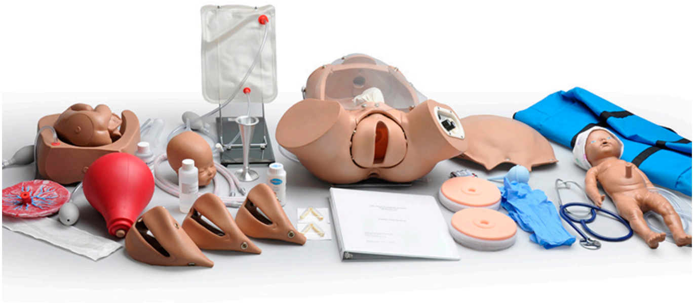
SUSIE® S500.200 Torso Avançado de Parto para onstetrícia