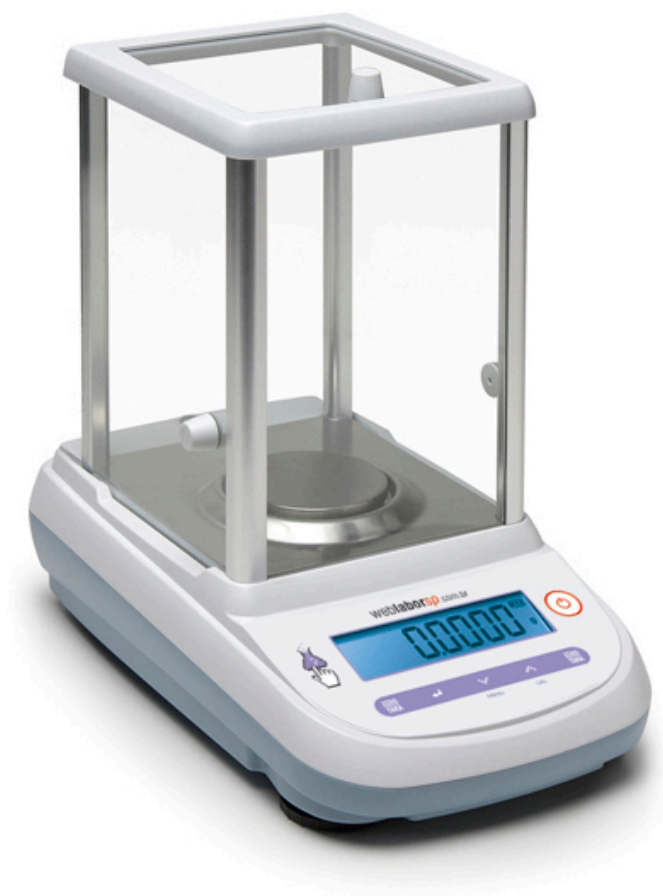
Balança Analítica 210g 0,0001g M214Ai com INMETRO