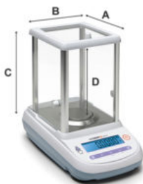
Balança Analítica 210g 0,0001G M214Ai

LCD retroiluminado com regulagem de contraste; Saída serial RS232; Unidade de pesagem selecionável; Contapeças; Limites; Pesagem percentual; Soma pesos; Pesagem animal; Função Densidade Sólidos e Líquidos; Função carga de ruptura; Capa plástica de proteção.