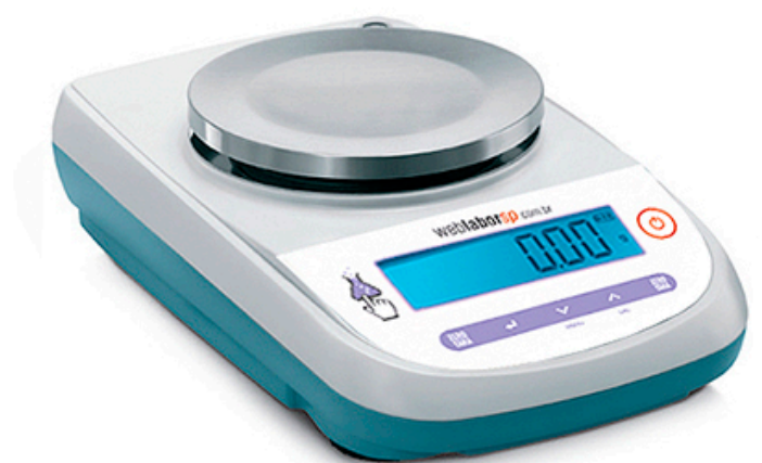
Balança Semi Analítica modelo 1500G 0,01g série L1502